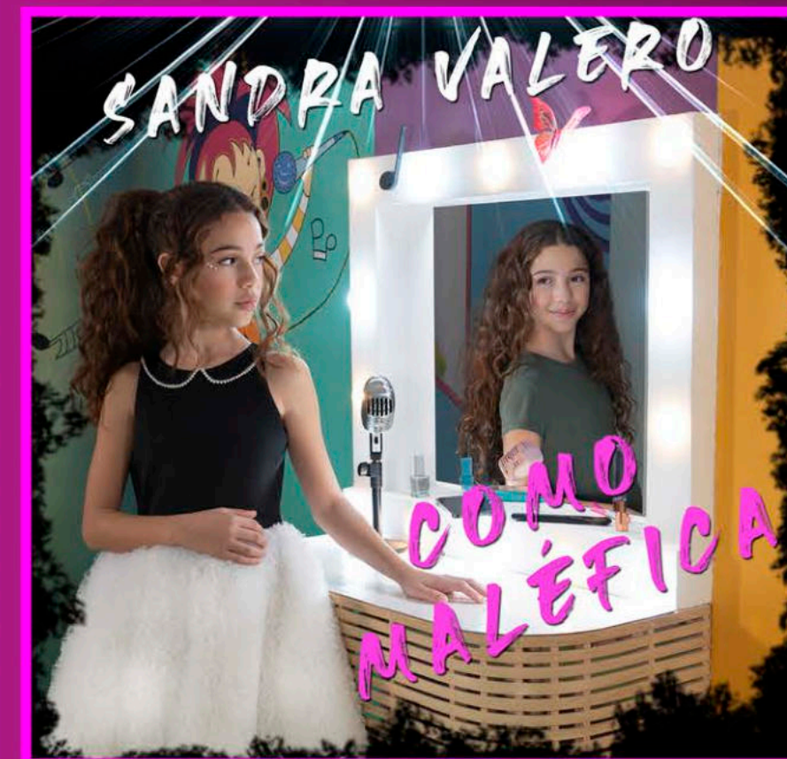
Portada disco “Como Maléfica”

Posteriormente el día 3 de Enero de 2025, en el Ateneo Mercantil de Valencia y en directo (con su propia banda) se presentó oficialmente ante los medios de comunicación su primer álbum.